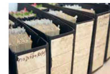
← Während ihres 60-jährigen Bestehens hat die Zentrale Stelle über 7660 Vorermittlungen geführt und damit den zuständigen Staatsanwaltschaften mit dem gesammelten Material die Strafverfolgung ermöglicht. In der Zentralkartei sind Personen, Tatorte und Einheiten auf mehr als 1,7 Millionen Karteikarten erfasst.

transnational agierender Vertreter des Rechts geblieben, der sich unermüdlich, jenseits der großen Bühne, um die juristische Anerkennung und Ahndung der Holocaustverbrechen bemühte.