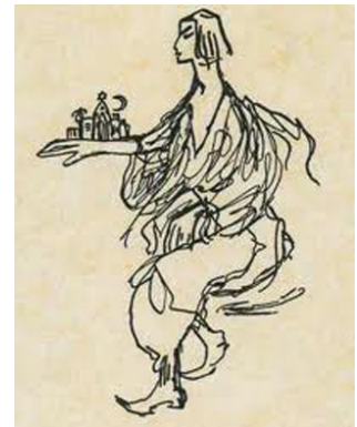
Abbildung: Titelbild »Hebräische Balladen«, Gedichtband von Else Lasker-Schüler, 1913 (Ausschnitt).