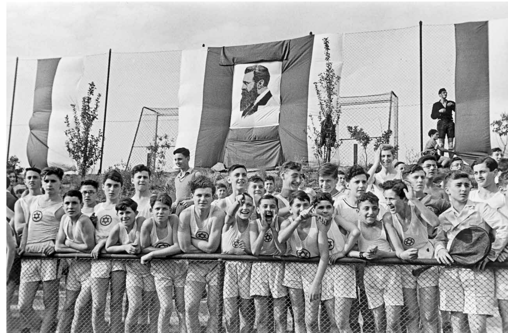
↑ Der Fotograf Herbert Sonnenfeld hielt das Handballspiel zwischen Makkabi Absalom aus Petah Tikwa in Palästina und einer Auswahlmannschaft des Makkabi Berlin am 24. Juni 1937 in Berlin fest.

Lassen Sie mich an einem konkreten Beispiel verdeutlichen, wie der Fokus auf Emotionen unser Verständnis des Zionismus verändert. 1948