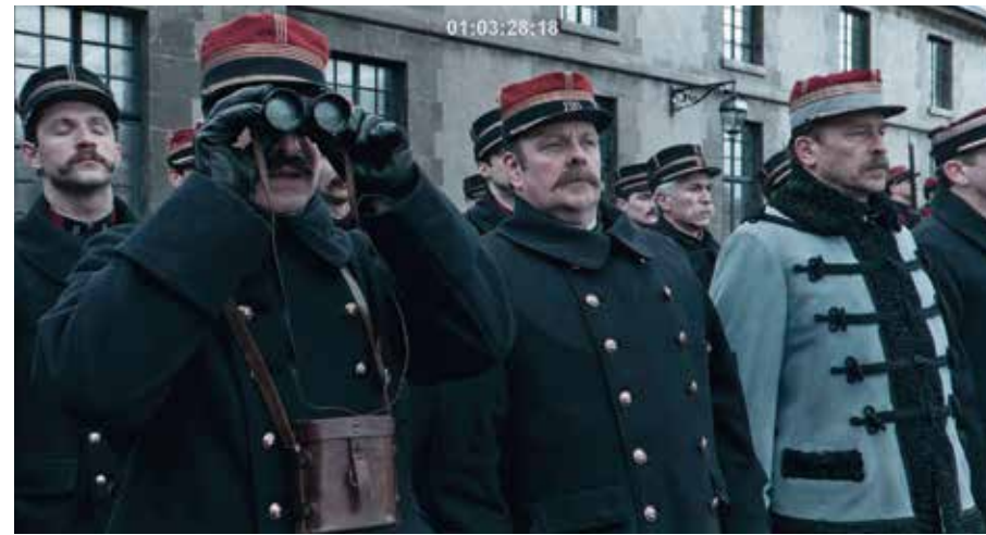
↑ Durch sein Fernglas verfolgt Picquart, wie Dreyfus' militärische Insignien öffentlich → entfernt werden.