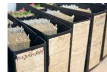
← Während ihres 60-jährigen Bestehens hat die Zentrale Stelle über 7660 Vorermittlungen geführt und damit den zuständigen Staatsanwaltschaften mit dem gesammelten Material die Strafverfolgung ermöglicht. In der Zentralkartei sind Personen, Tatorte und Einheiten auf mehr als 1,7 Millionen Karteikarten erfasst.

transnational agierender Vertreter des Rechts geblieben, der sich unermüdet, jenseits der großen Bühne, um die juristische Anerkennung und Ahndung der Holocaustverbrechen bemühte.