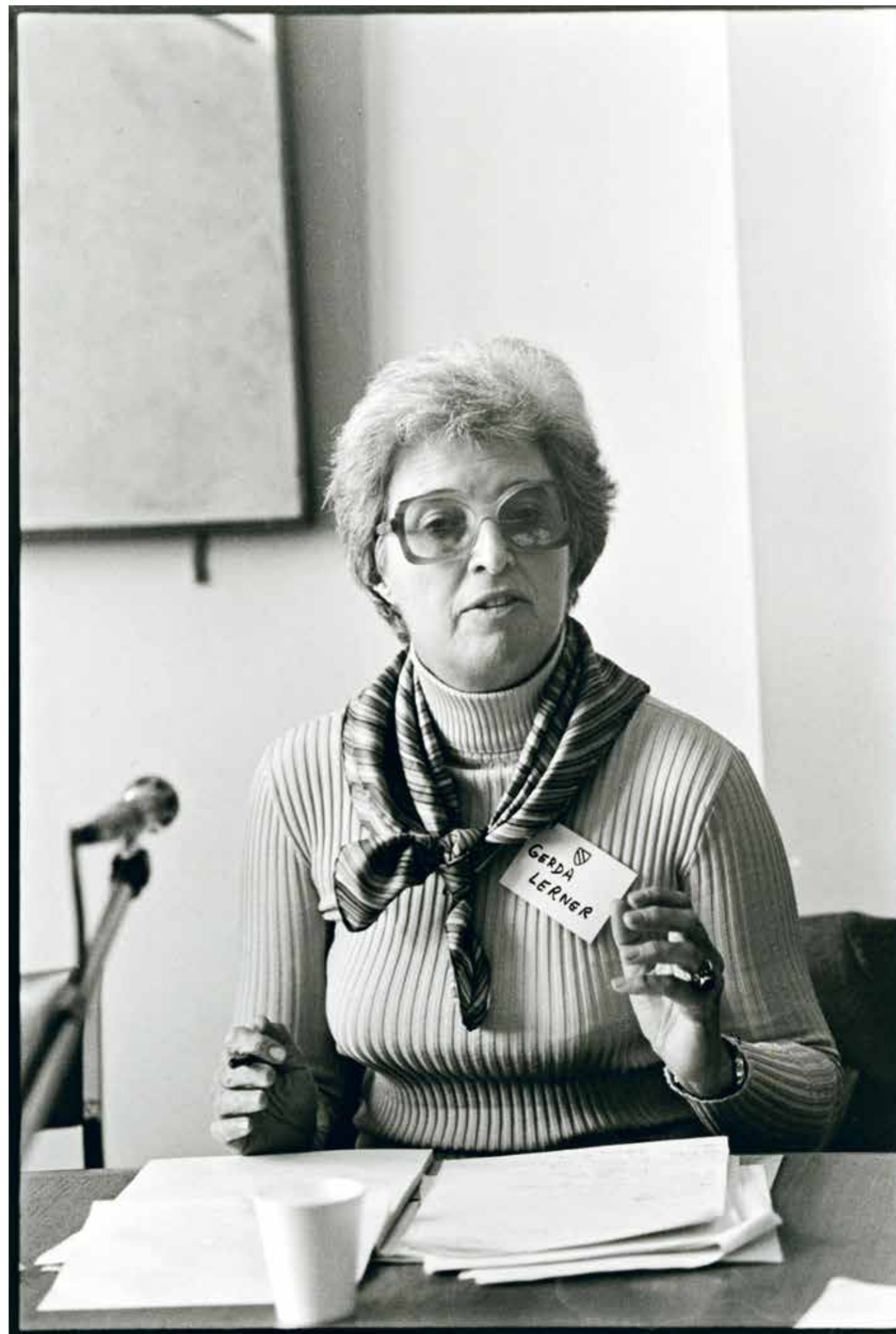
↑ Gerda Lerner im Oktober 1976 auf der Radcliffe Conference, die sich mit beruflichen und gesellschaftspolitischen Perspektiven gebildeter Frauen befasste.

Gegen Ende ihrer Laufbahn etablierte sich die amerikanisch-jüdische Frauengeschichte als ein neuer Forschungszweig. Da Lerner erkannte, wie schwierig es ist, das Selbstverständnis jüdischer Frauen zu definieren und historisch zu erforschen, wurde sie eine engagierte Unterstützerin des Jewish Women's Archive, einer 1995 gegründeten unabhängigen Organisation, die sich die Sammlung und Vermittlung von Quellen über jüdische Frauen in Nordamerika und ihre Geschichte zum Auftrag gemacht hat, sowie Mitglied seines wissenschaftlichen Beirats. Das Feld der jüdischen Frauengeschichte zog Lerner auch aufgrund seiner intellektuellen Aspekte an. Fragen nach dem multidimensionalen und transnationalen Charakter der Identitäten jüdischer Frauen, nach ihrem doppelten Bewusstsein als Zuge-