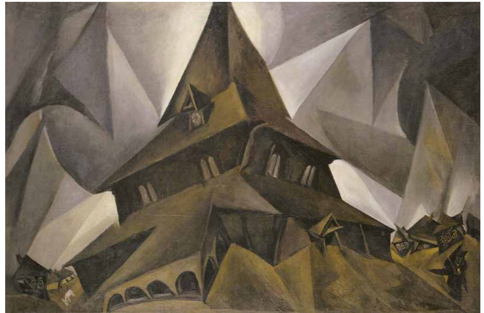
↑ Issachar Ber Ryback fasste im Revolutionsjahr 1917 eine traditionelle Synagoge in bewegte avantgardistische Formen.