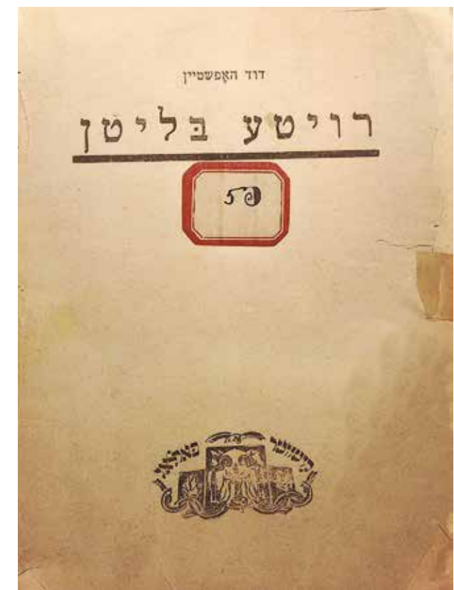
↑ Titelblatt von Dovid Hofshteyns Royte blitn (Rote Blüten) aus dem Jahr 1920.

Perets Markish bringt die Zeitenwende am radikalsten zum Ausdruck. Wie sein Vorbild Majakowski sieht Markish die Revolution als primär geistige Erscheinung (Majakowski, der „Trommler der Revolution“, wird 1930 Selbstmord begehen): Der Geist der Revolution und der Geist der Kreativität gehen für ihn fließend ineinander über. 1917 besingt der Dichter in zwei berühmten Werken das von den Fesseln der Zeit befreite Subjekt. In Ikh zegn zikh mit dir... (Ich nehme Abschied von dir...) hat das lyrische Ich die Vergangenheit und damit die jüdische Tradition und schmerzreiche Geschichte abgeschüttelt. Es huldigt allein dem „Jetzt“, dem reinen Augenblick (dank der Revolution). In Markishs