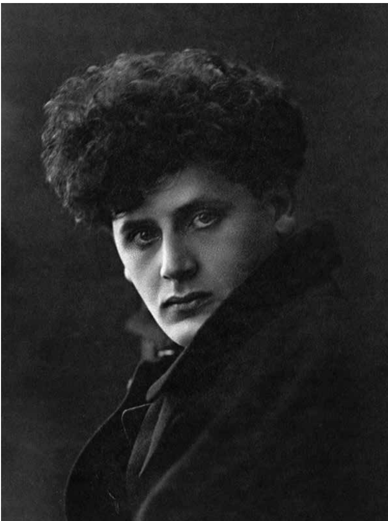
↑ Perets Markish, Jekaterinoslaw (Dnipro), 1917.

Alte Grüppchen, verlebte Frösche Auf baufälligen, zerbrochenen „Vordächern“ Quaken heiser und quaken alt Über den Marktplatz, der seine Zeit gehabt, in jeder Ritze.